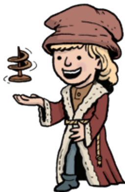
LEONARDO DA VINCI